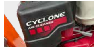
EINFACHES WECHSELN DES LUFTFILTERS