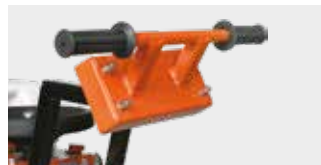
HANDGRIFF INKLUSIVE VIBRATIONS-DÄMPFER